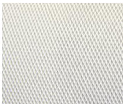
Profil "en pointes de diamant"